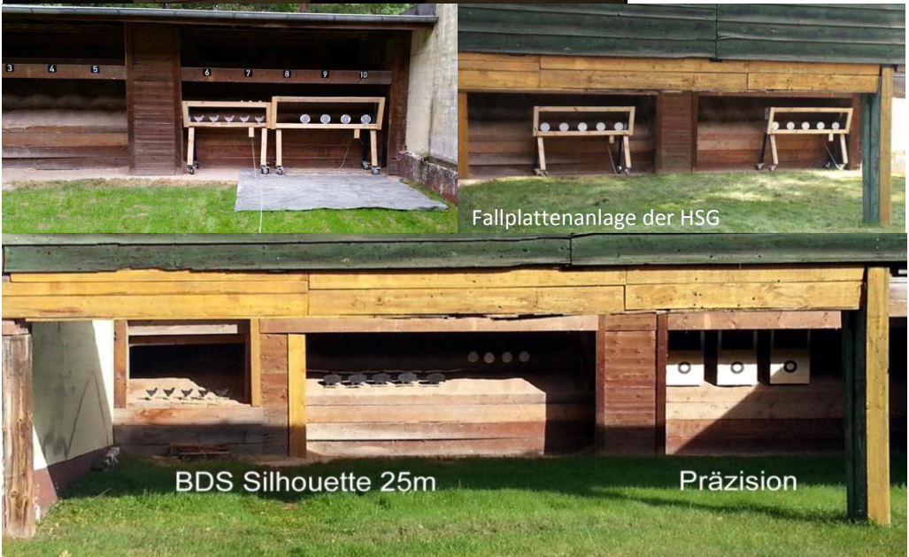
Fallplattenanlage der HSG