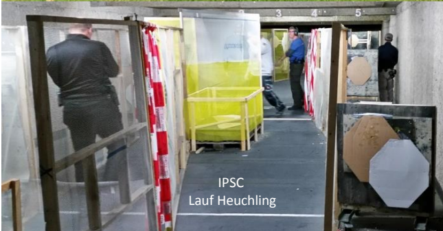
IPSC Lauf Heuchling