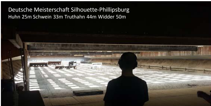
Deutsche Meisterschaft Silhouette-Phillipsburg Huhn 25m Schwein 33m Truthahn 44m Widder 50m