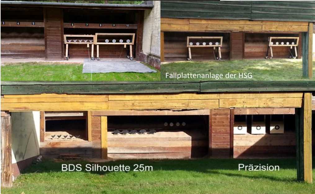
Fallplattenanlage der HSG