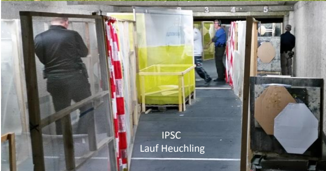
IPSC Lauf Heuchling